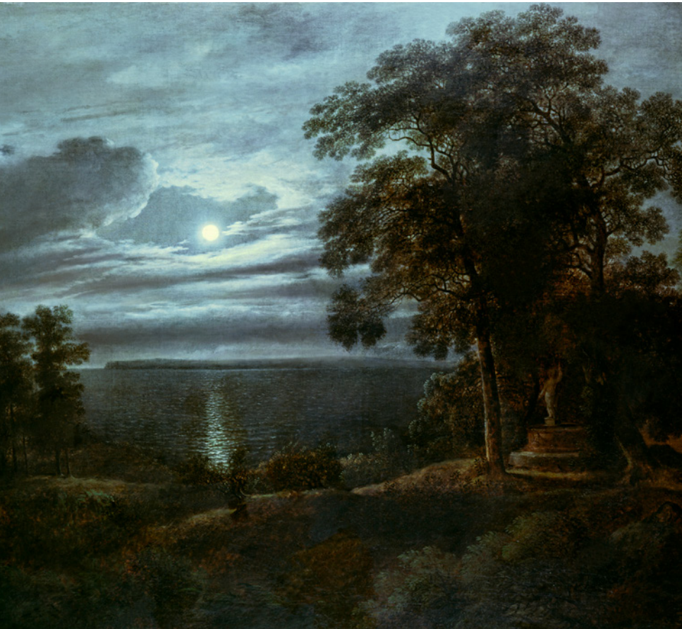
Vollmondstimmung am See, gemalt von Johann Christian Klengel 1804